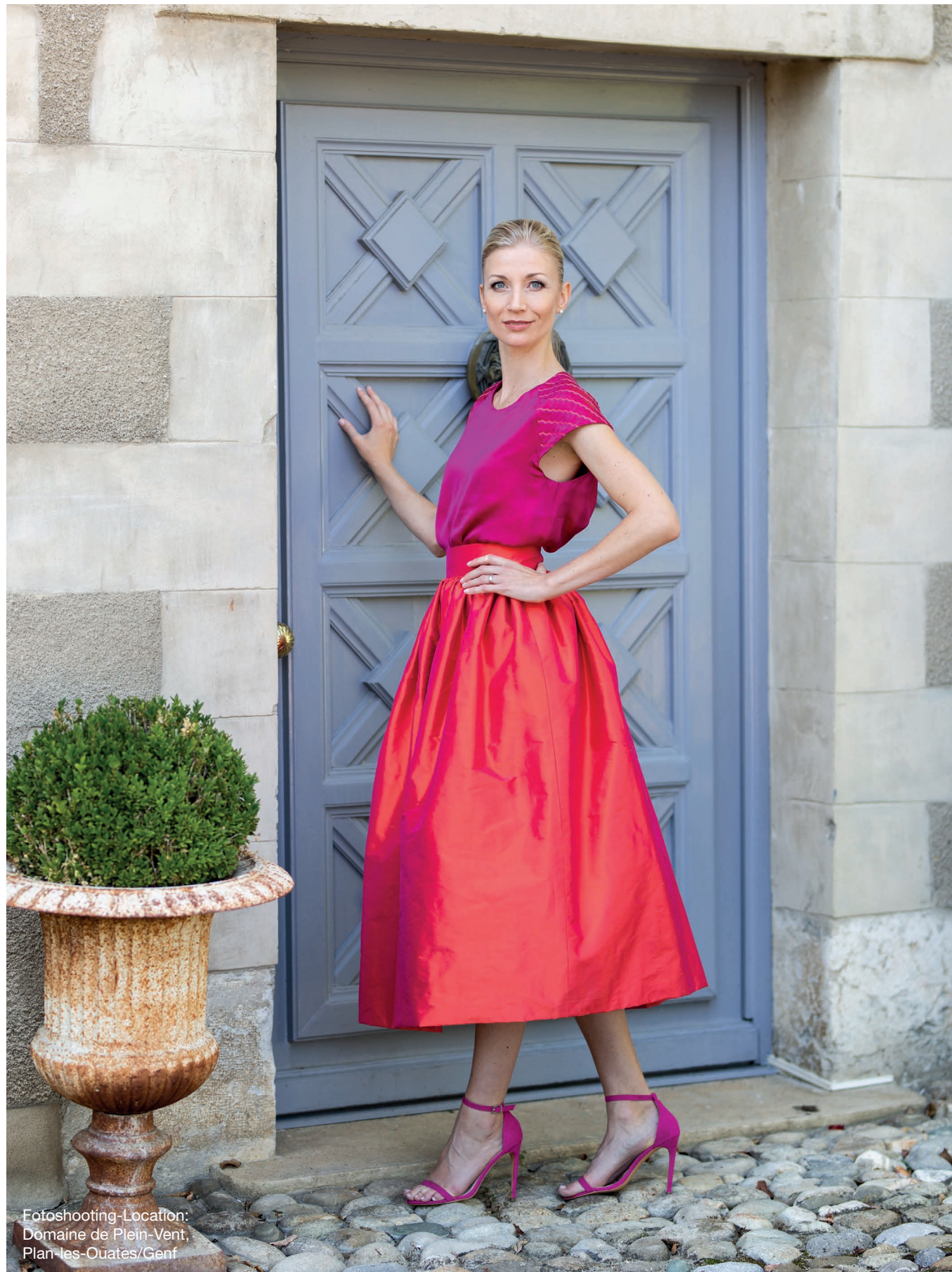
Fotoshooting-Location: Domaine de Plein-Vent, Plan-les-Quates/Genf